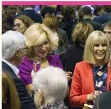
Plusieurs centaines d'invités s'étaient déplacés pour rendre hommage aux lauréates des prix Florence.