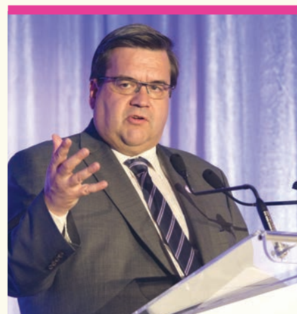
Denis Coderre , maire de Montréal.