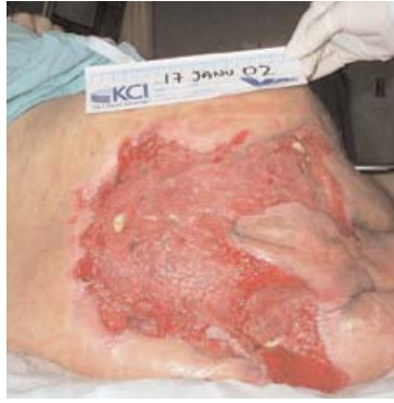
2002-01-17 – 10 sem. après le VAC®