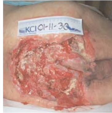
2001-11-30 – 3 sem. après le VAC®

intermittente ou continue. L'éponge noire possède une grande porosité qui facilite le drainage de l'exsudat, ce qui entraîne une diminution de l'œdème périphérique et une augmentation du débit sanguin des tissus adjacents.