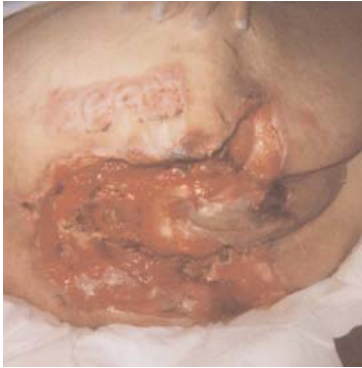
2001-11-05 – jour 0