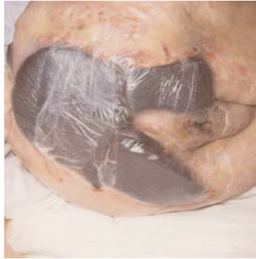
2001-11-05 – jour 0 avec le VAC®