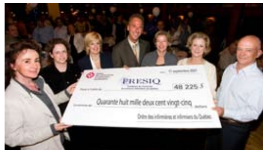
Tournoi de golf 2007

Enfin, la Fondation a reçu un don de 5 000$ du Regroupement des infirmières et infirmiers de liaison du Québec à la suite de la dissolution de l'association.